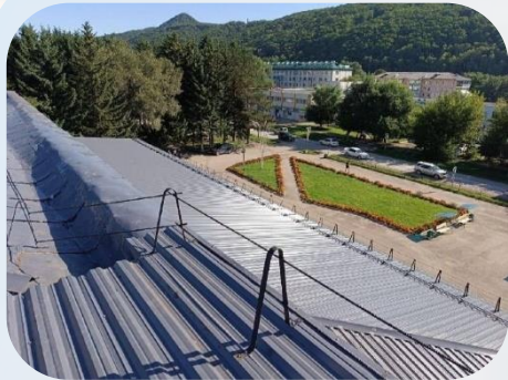
Киноконцертный зал «Россия»