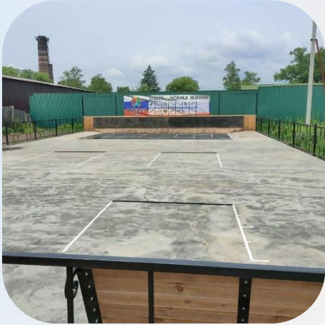
Площадка для игры в городки