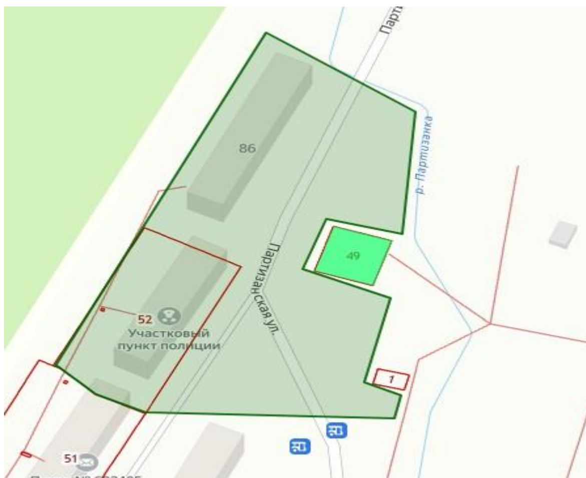
Схема границ территории ТОС «Партизанская 88-86» Кавалеровского муниципального округа

Приложение к описанию границ территории ТОС «Партизанская 88-86» Кавалеровского муниципального округа