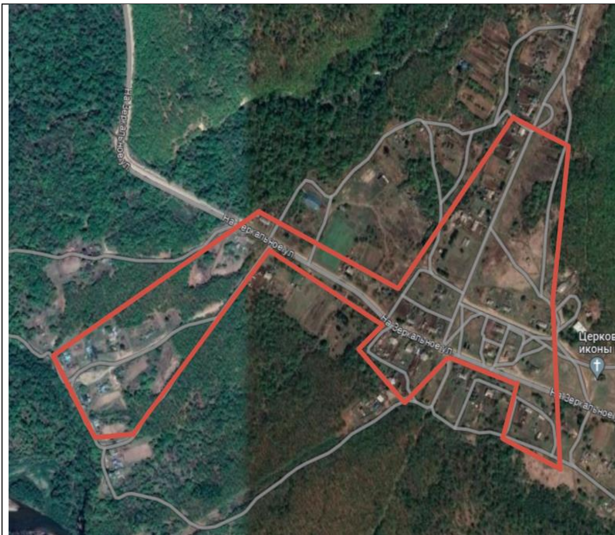
Схема границ территории ТОС «село Богополь» Кавалеровского муниципального округа

— - обозначение границы территориального общественного самоуправления (ТОС) «село Богополь».