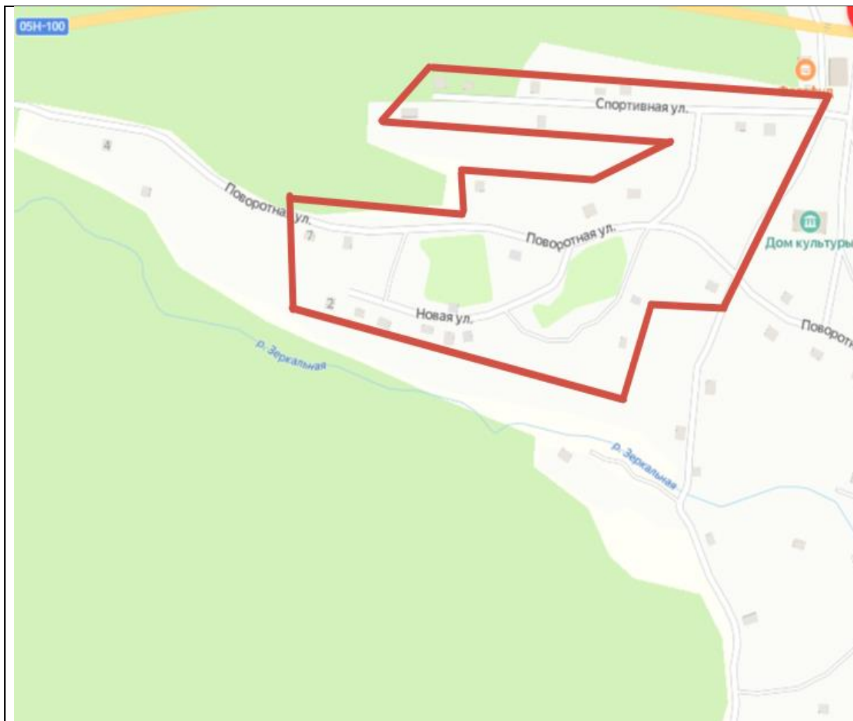
Схема границ территории ТОС «Рудненцы» Кавалеровского муниципального округа