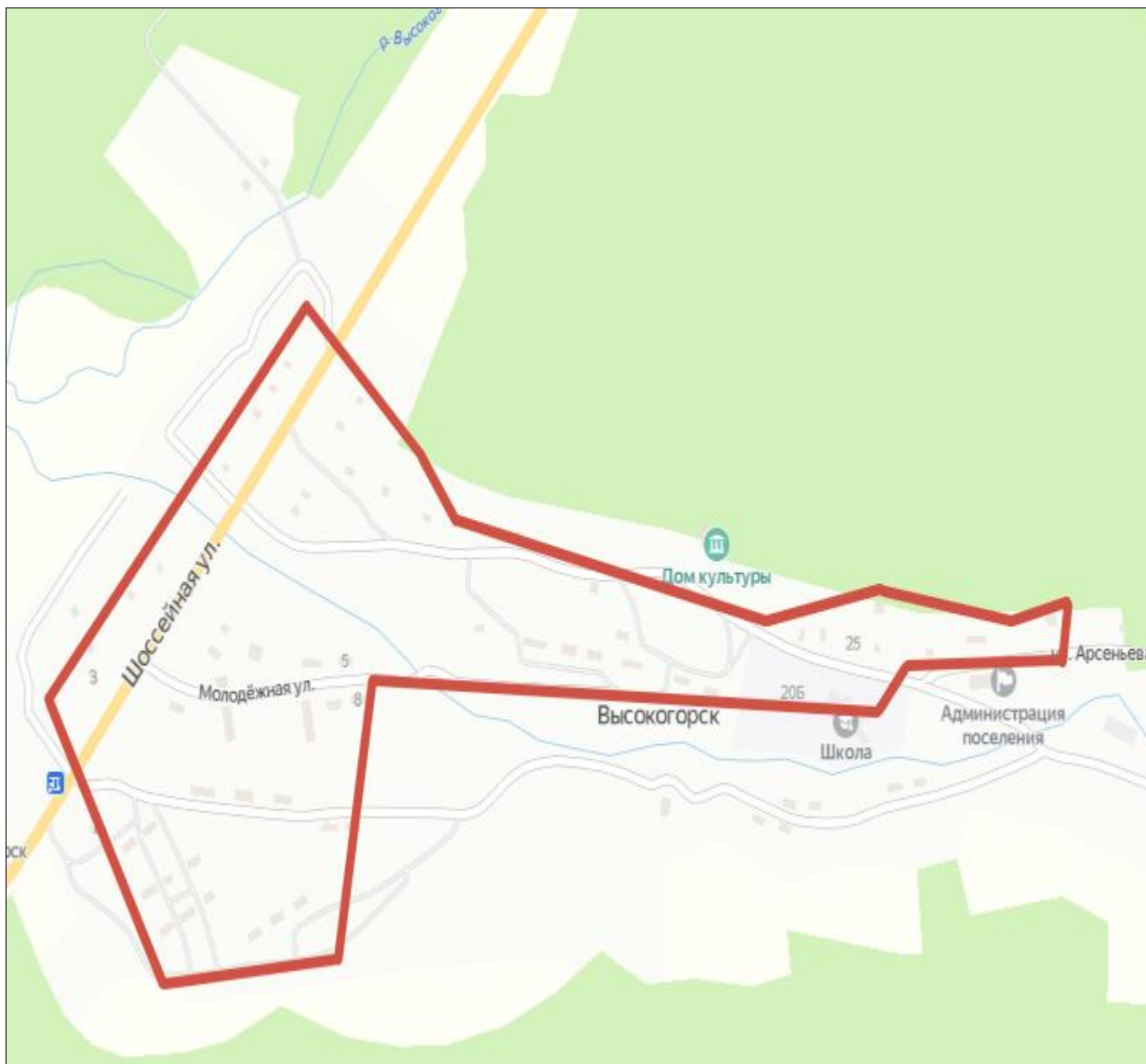
Схема границ территории ТОС «Высокогорцы» Кавалеровского муниципального округа

— - обозначение границы территориального общественного самоуправления (ТОС) «Высокогорцы».