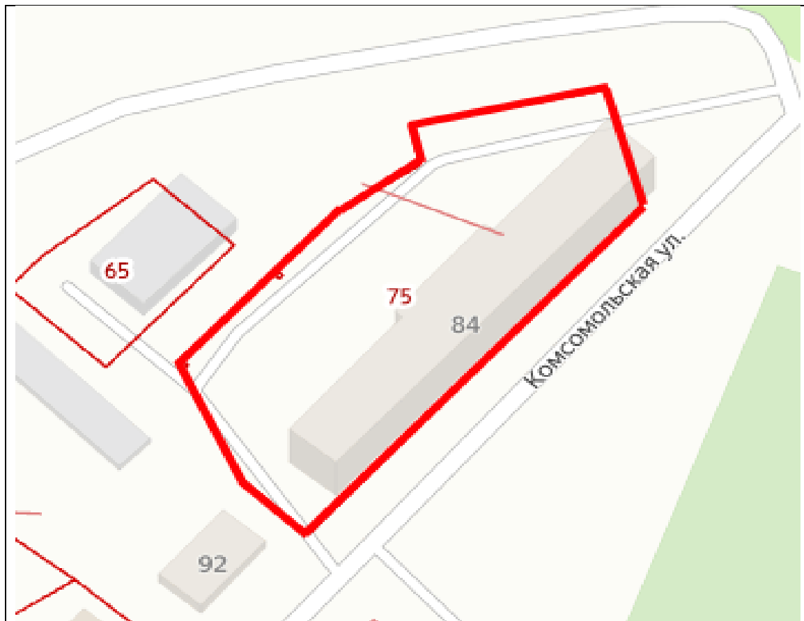
Схема границ территории ТОС «Крейсер» Кавалеровского муниципального округа