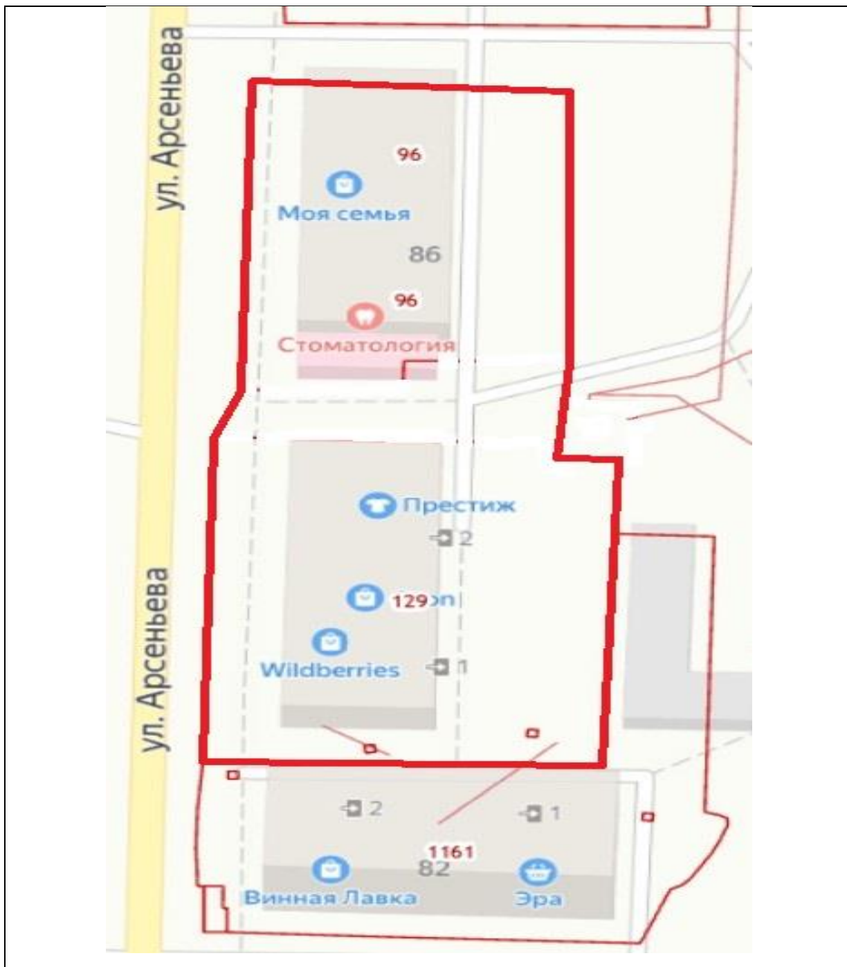
Схема границ территории ТОС «Арсеньева 84, 86» Кавалеровского муниципального округа