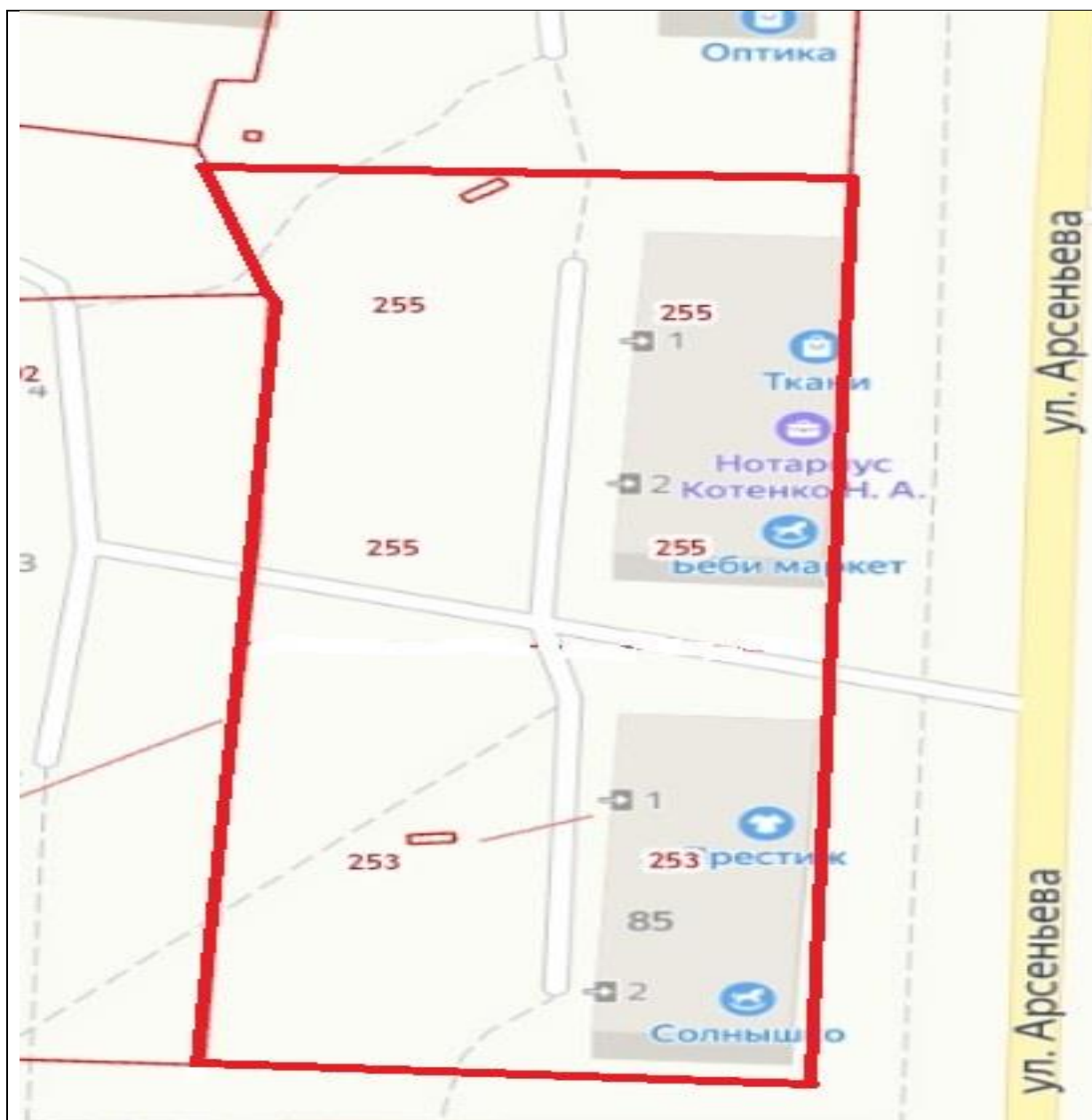
Схема границ территории ТОС «Арсеньева 85, 87» Кавалеровского муниципального округа