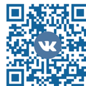
Мы в Вконтакте