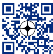
Мы в Дзене