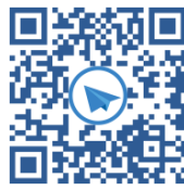
Телеграм-ЧАТ экспертов, специалистов ОТиПБ